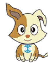
行政相談の マスコット キャラクター 「キクーン」