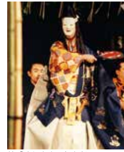
能「清経」坂真太郎

チケット販売場所 カンフェティHP (TEL 0120-240-540でも申込可)、浅草公会堂窓口