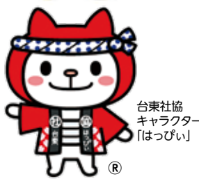
台東社協 キャラクター 「はっぴい」