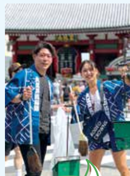
登録団体 東京力車の 皆さん