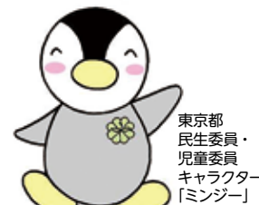
東京都 民生委員・ 児童委員 キャラクター 「ミンジー」