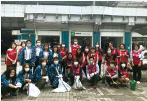
昨年の区内一斉清掃 第一生命保険株上野総合支社および 上野・上野第二・上野第三営業オフィスの皆さん

区では、「東京都台東区ポイ捨て行為等の防止に関する条例」で、5月30日を「環境美化の日」と定めています。そこで近郊の日曜日である6月2日(日)に、「区内一斉清掃」を実施します。